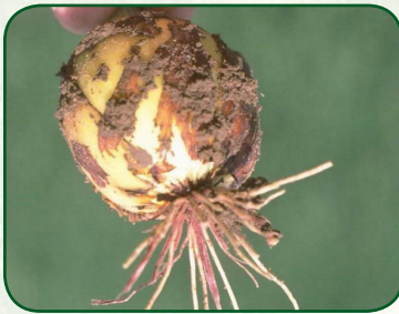
Pink root rot (Fungus- Phoma terrestris )