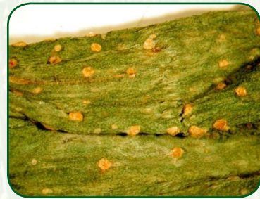
Onion rust (Fungus- Puccinia porri )