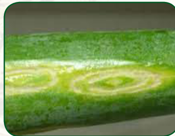
Iris yellow spot disease (Virus- IYSV)