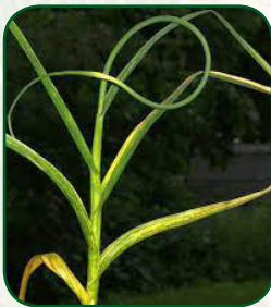
Yellow dwarf (Virus- OYDV)