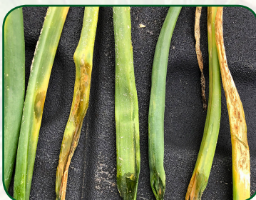
Onion leaf streak (Bacteria- Pseudomonas viridiflava )