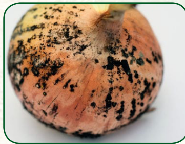
Onion black mold (Fungus- Aspergillus niger )