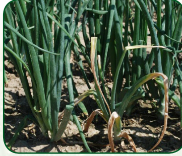
Fusarium damping off (Fungus- Fusarium oxysporum )