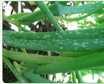
Botrytis leaf blight (Fungus- Botrytis squamosa )