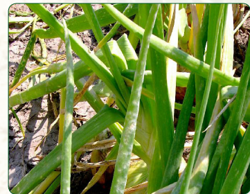
Powdery mildew (Fungus- Leveillula taurica )