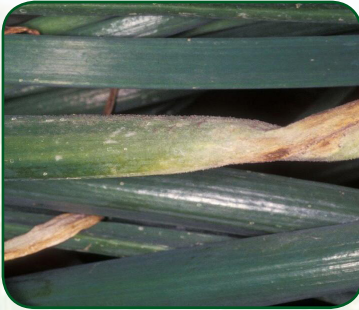
Downey mildew (Fungus- Peronospora destructor )