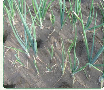
Onion smut (Fungus- Urocystis colchici )